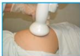
Reflectrode 35mm, 1200 impulsos, E4 -E7 de energia